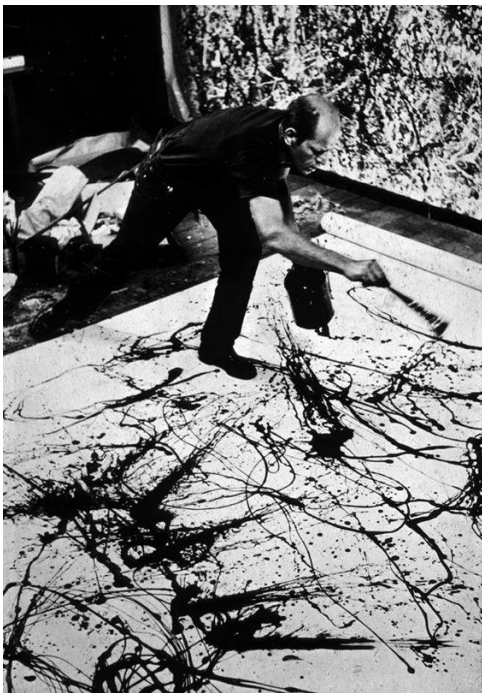
Lámina nº 3. El pintor Jackson Pollock realizando una de sus obras.