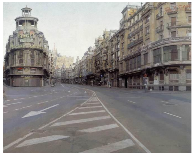
Lámina nº 4. Gran Vía de Madrid (1974-1981), de Antonio López, colección privada.