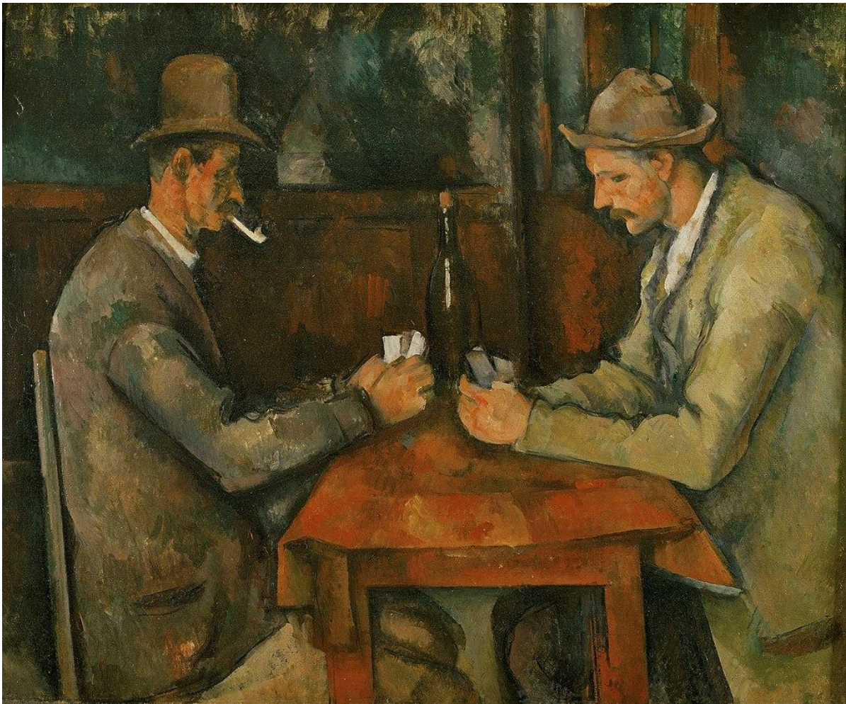
Lámina nº 2. Los jugadores de cartas (hacia 1894-1895), Paul Cézanne, Museo de Orsay, París.