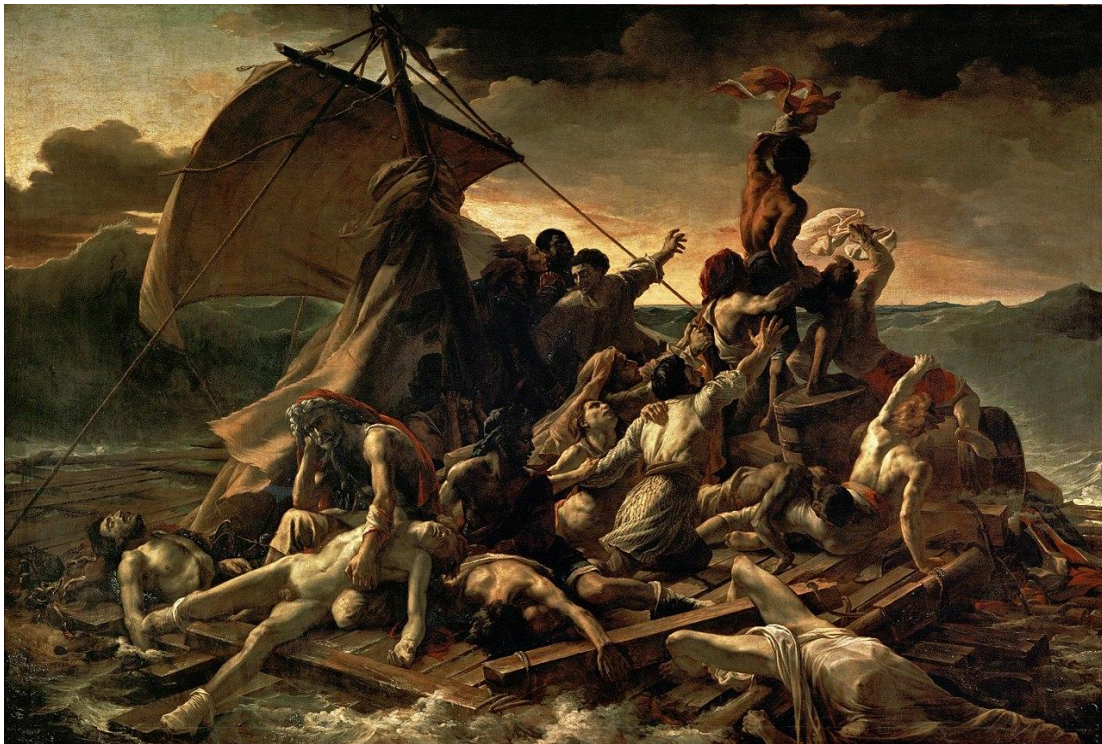
Lámina nº 1. La balsa de la Medusa (1819), Théodore Géricault, Museo del Louvre, París.