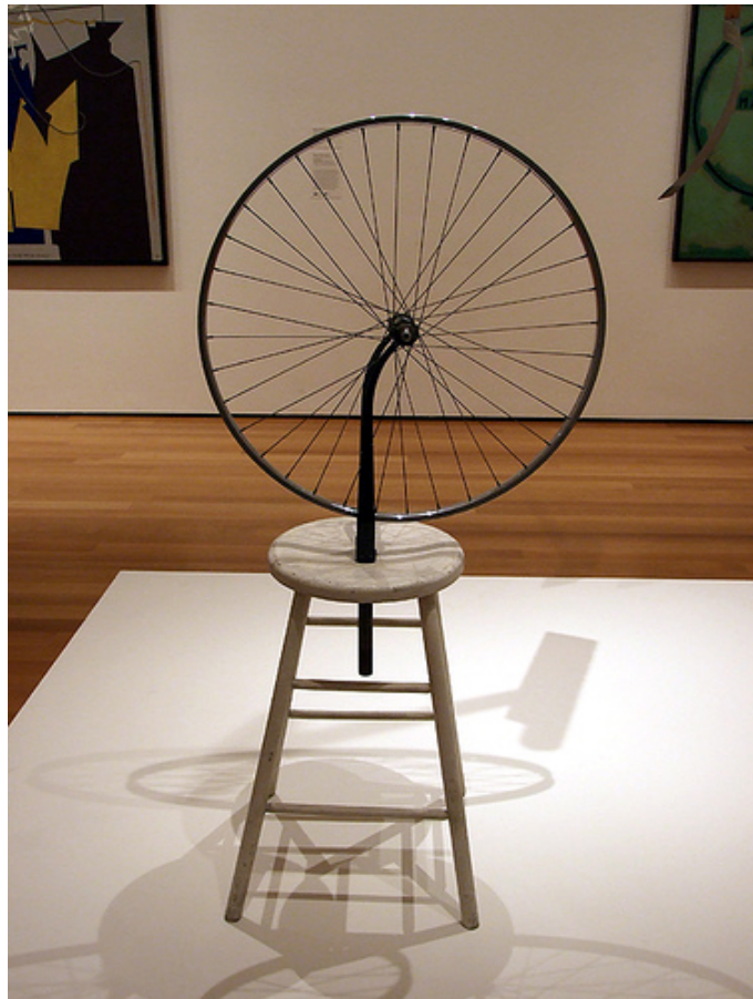
Lámina 2. Marcel Duchamp. Rueda de bicicleta . 1913. Madera y metal. 1,26 m. de altura. Sidney Janis Gallery, Nueva York.