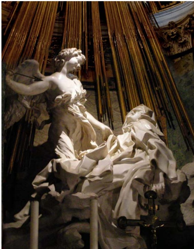
Lámina 3. Gian Lorenzo Bernini. Éxtasis de Santa Teresa . Hacia 1647. Mármol. 3,50 m. de altura. Capilla Cornaro en la iglesia de Santa María de la Victoria, Roma.