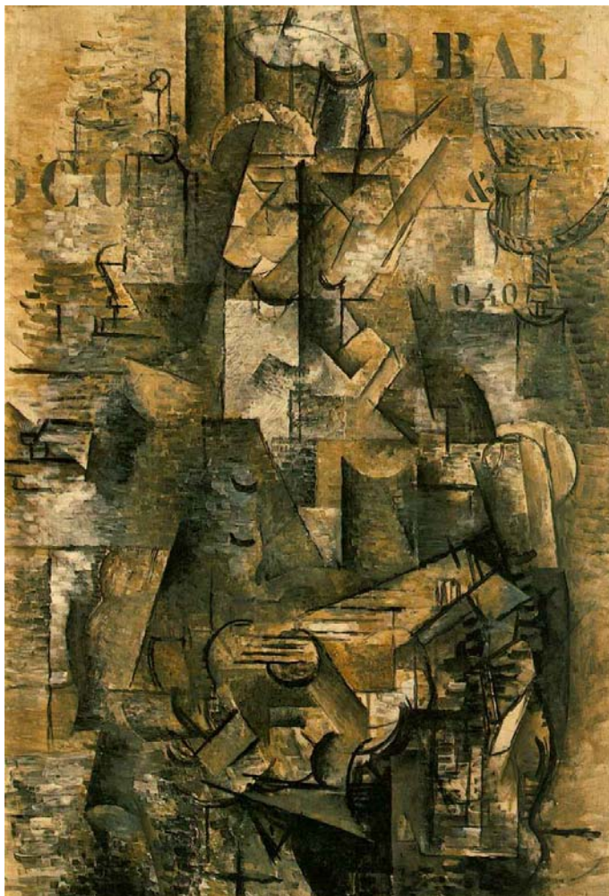
Lámina 4. Georges Braque. El portugués . 1911. Óleo sobre lienzo. 1,16 x 0,81 m. Kunstmuseum, Basilea.