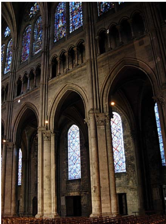
Lámina 3: Catedral de Chartres (Francia). Vista interior, nave central. 1194-1220.