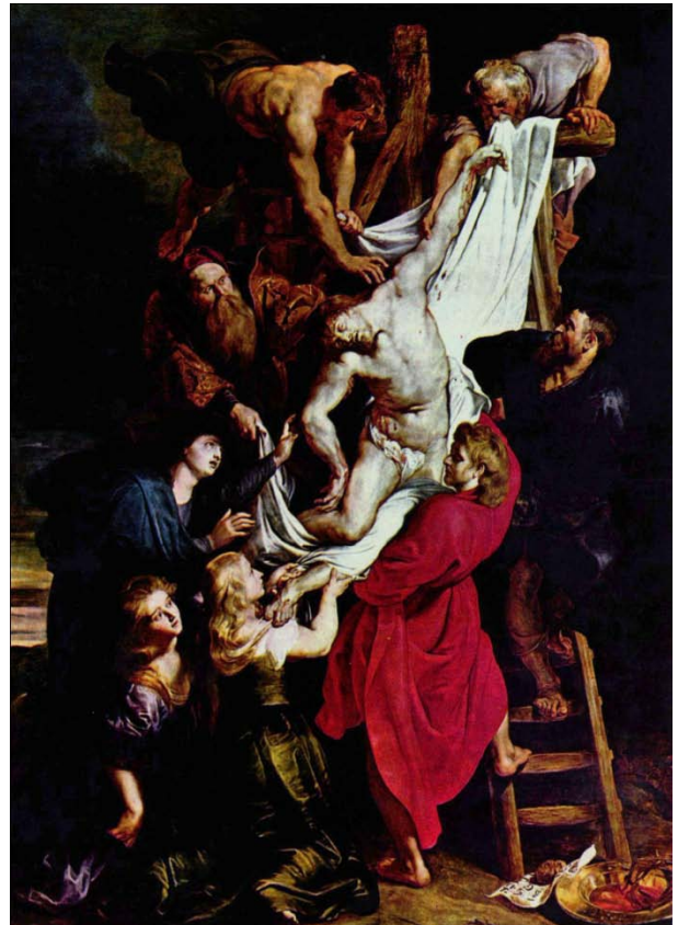
Lámina 2: Peter Paul Rubens. Descendimiento de la Cruz . 1611-1614. Óleo sobre tabla. 4,25 x 3,30 m. Catedral de Amberes.