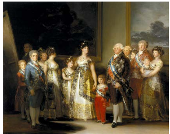
Lámina 2. Francisco de Goya. La familia de Carlos IV . 1800. Óleo sobre lienzo. 2,80 x 3,36 m. Museo del Prado, Madrid.