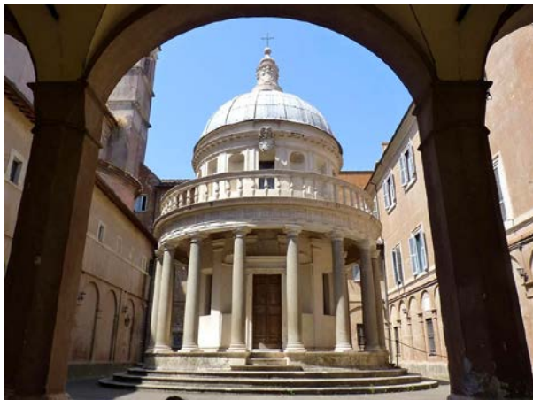
Lámina 1. Donato Bramante. San Pietro in Montorio , Roma. 1502.