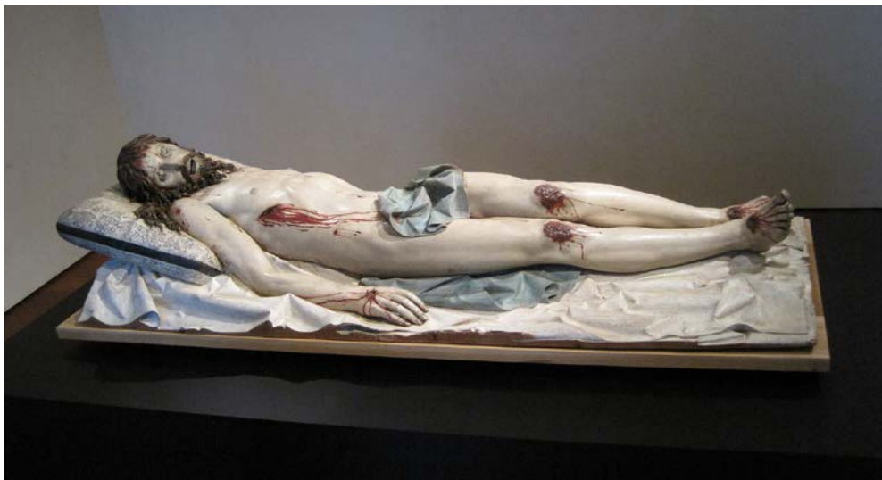
Lámina 3. Gregorio Fernández. Cristo yacente . Hacia 1627. Madera policromada. 1,75 m de longitud. Museo Nacional de Escultura, Valladolid.