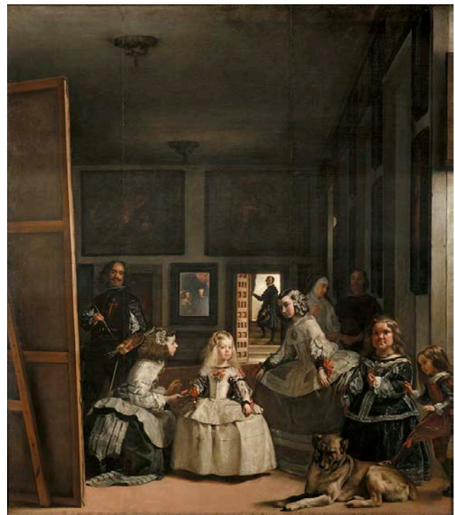
Lámina nº 2. Las Meninas (1656), Diego Velázquez, Museo del Prado, Madrid.