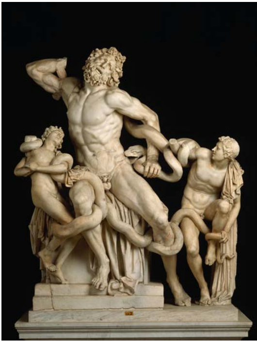
Lámina nº 1. Laocoonte y sus hijos (copia de mármol de mediados del siglo I d.C.), Agesandro, Polidoro y Atenodoro de Rodas, Museo Pío-Clementino, Vaticano.