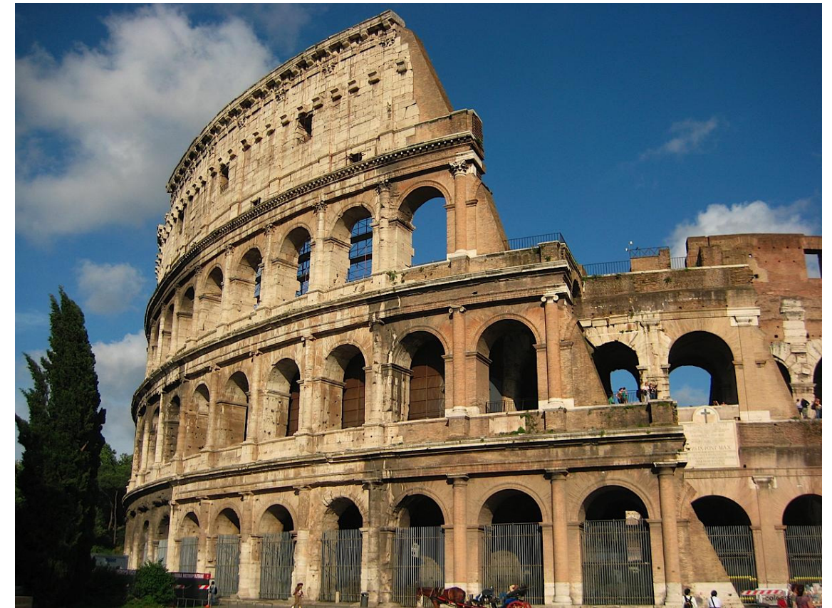
Lámina 1: El Coliseo (Roma). 70-80 después de J.C.