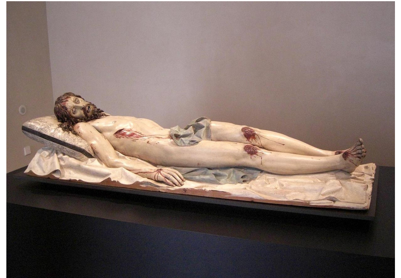
Lámina 3: Gregorio Fernández. Cristo yacente . Hacia 1625-1630. Madera policromada. 1,75 m. de longitud. Museo Nacional Colegio San Gregorio, Valladolid.