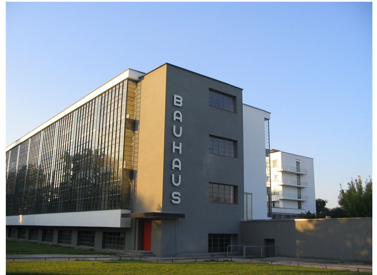
Lámina 4: Walter Gropius. Edificio de la Bauhaus en Dessau , 1925-1926.