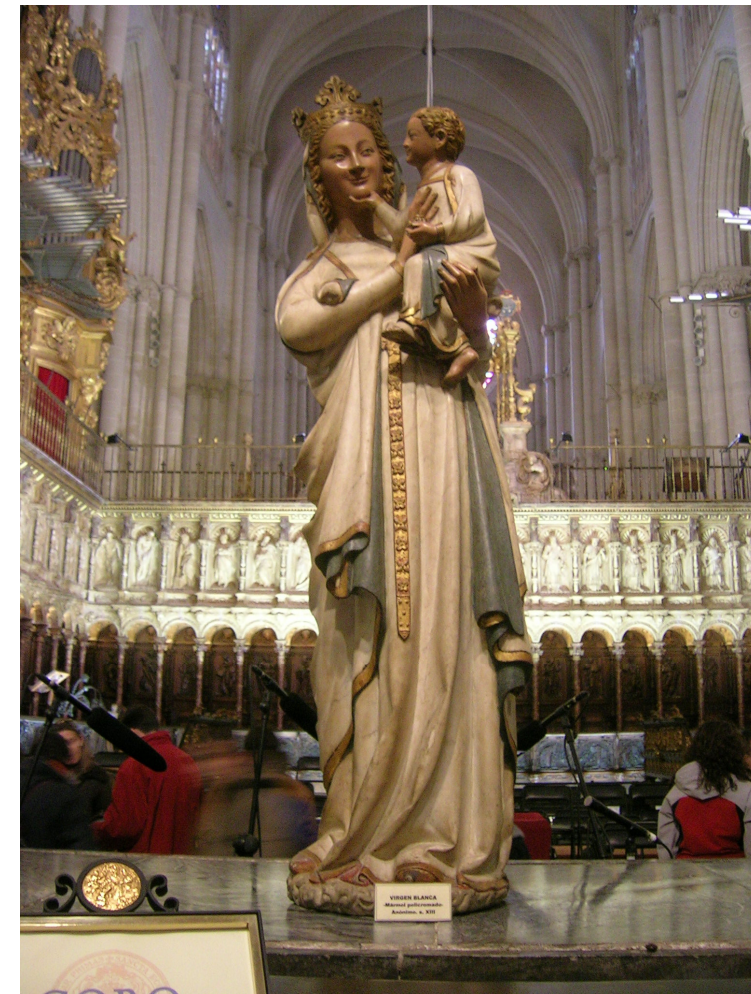
Lámina 1: Virgen Blanca . Hacia 1240. Mármol policromado. Catedral de Toledo.