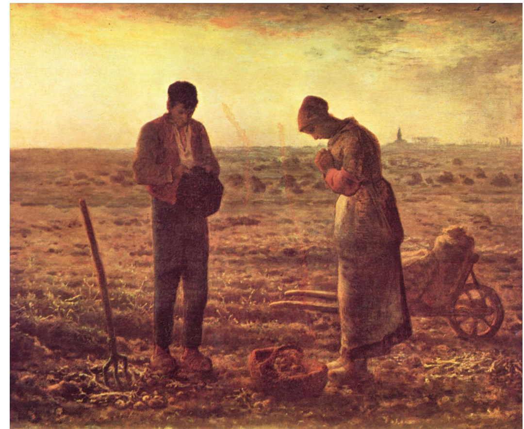
Lámina 2: Jean-François Millet. El Ángelus . 1858. Óleo sobre lienzo. 0,55 x 0,66 m. Museo del Louvre, París.