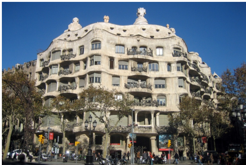
Casa Milà o La Pedrera (1905-1912), Antoni Gaudí, Barcelona.