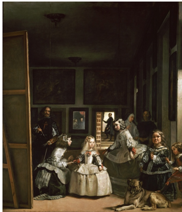
Las meninas (1656), Diego Velázquez, Museo del Prado, Madrid.