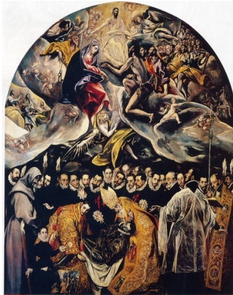
El entierro del conde Orgaz (1587), El Greco, Iglesia de Santo Tomé, Toledo.