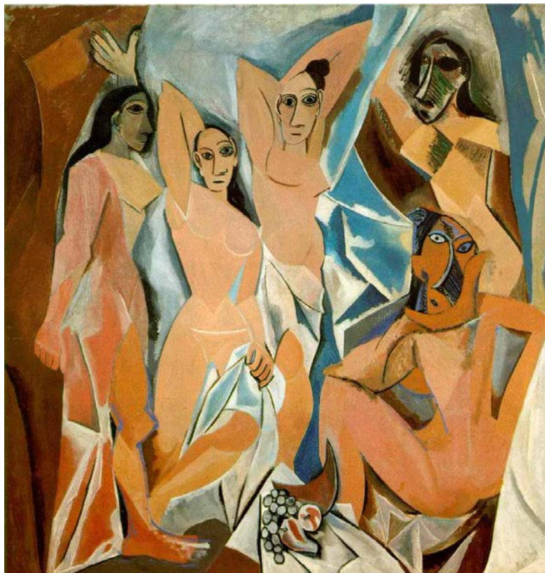
Lámina nº 4. Las señoritas de Avignon (1907), de Pablo Picasso, Museo de Arte Moderno de Nueva York.