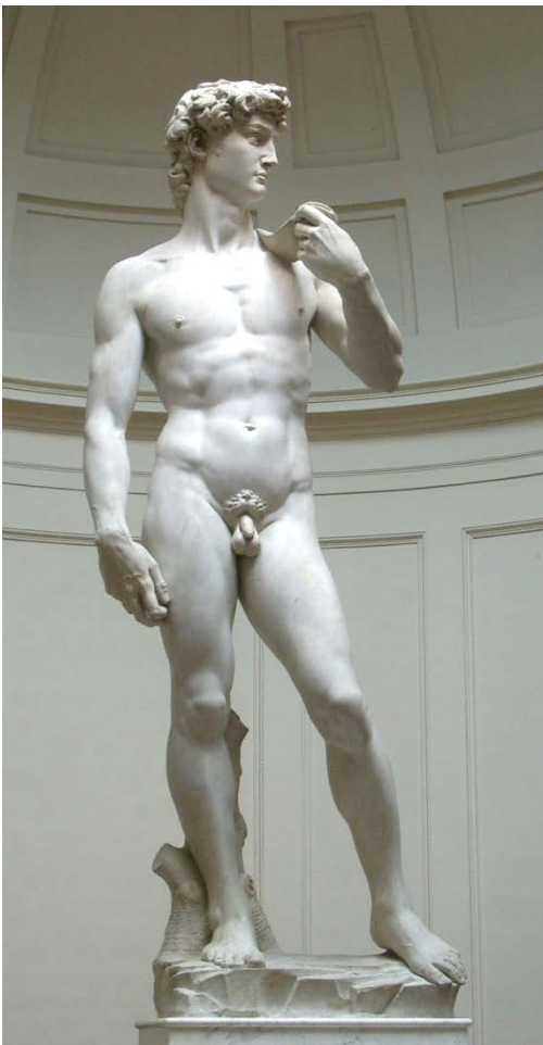
Lámina nº 1, David (1501-1504), Miguel Ángel Bounarroti (Galería de la Academia, Florencia).