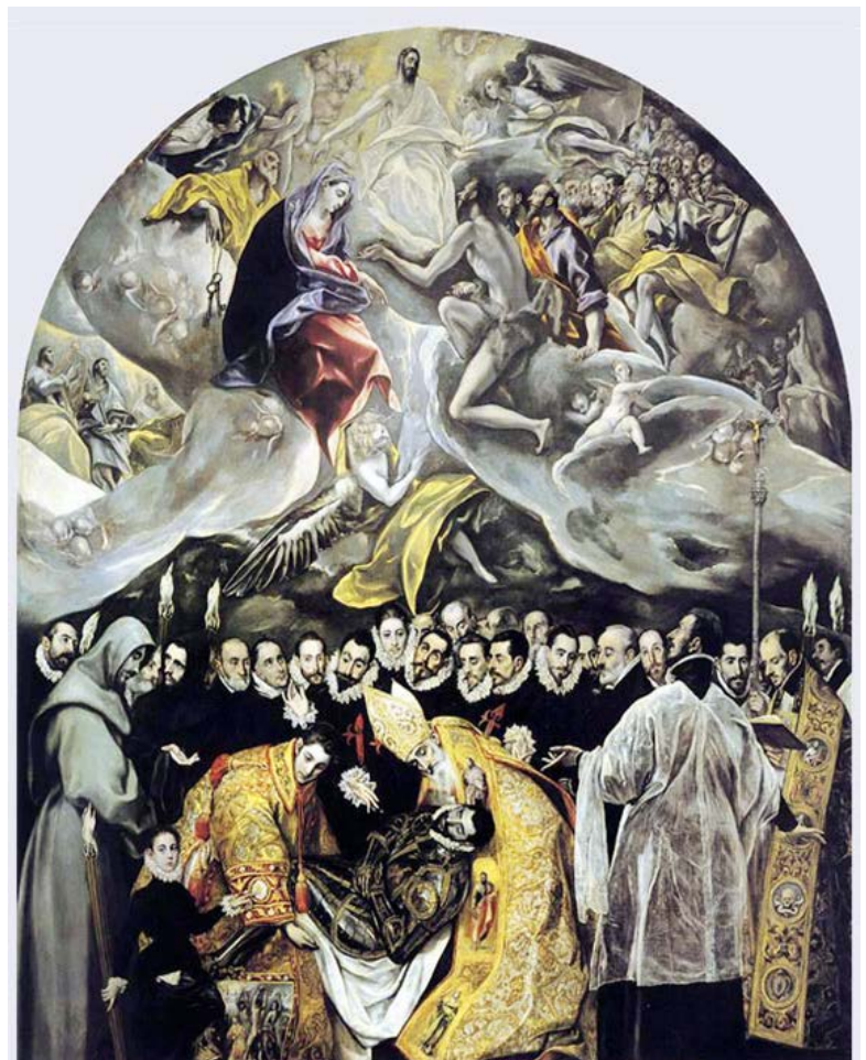
Lámina nº 2. El entierro del conde Orgaz (1587), El Greco, Iglesia de Santo Tomé, Toledo.