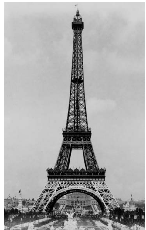
Lámina nº 2. Tour Eiffel (1887-1889), Gustave Eiffel (París).