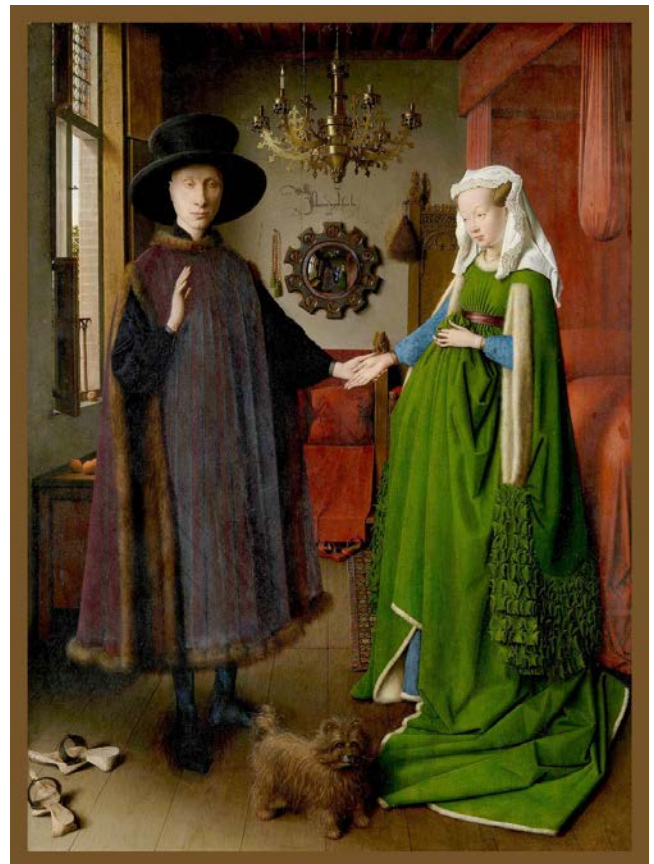
Lámina nº 4. El matrimonio Arnolfini (1434), de Jan van Eyck, National Gallery, Londres.