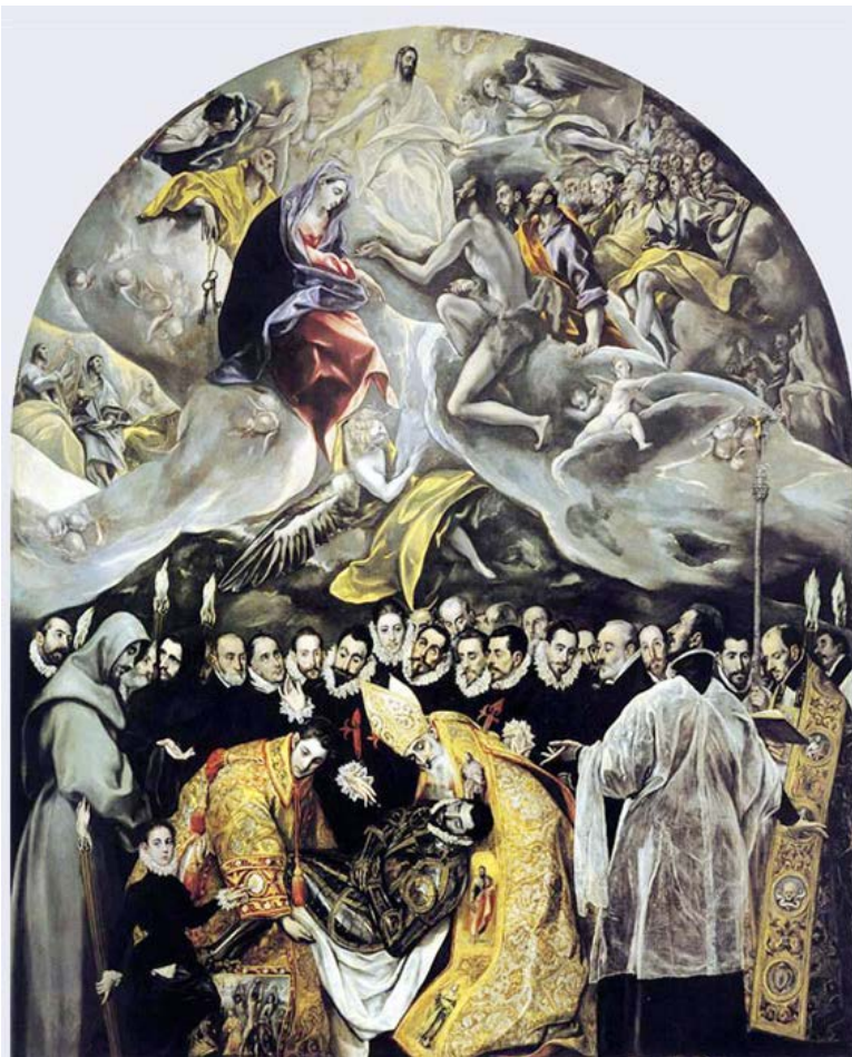
Lámina nº 1. El entierro del conde Orgaz (1587), El Greco, Iglesia de Santo Tomé, Toledo.