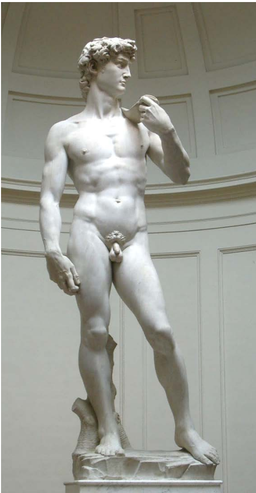
Lámina nº 1. David (1501-1504), Miguel Ángel Buonarroti, Galería de la Academia, Florencia.