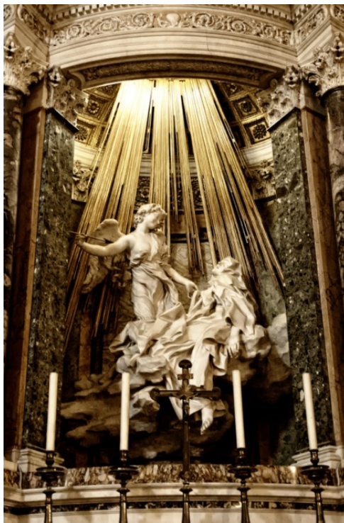
Lámina nº 4. El éxtasis de Santa Teresa (1647-1651), G. L. Bernini, Santa María de la Victoria, Roma.