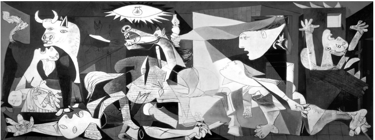
Lámina nº 3. Guernica (1937), de Pablo Picasso, Museo Nacional Centro de Arte Reina Sofía, Madrid.