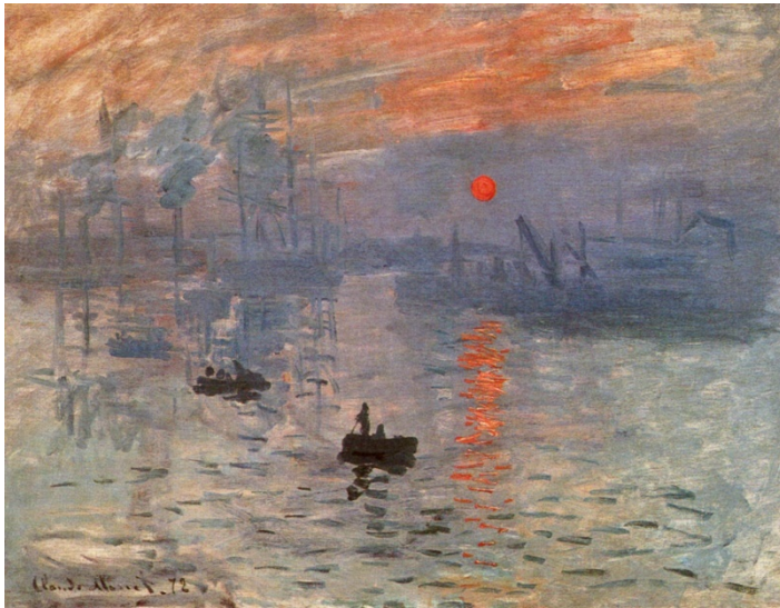
Lámina nº 1. Impresión, sol naciente (1872), de Claude Monet, Museo Marmottan-Monet, París.