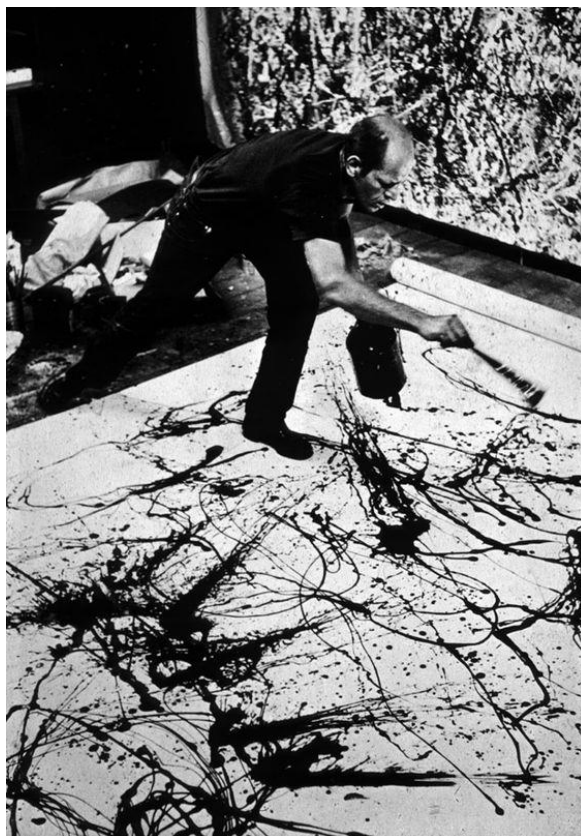
Lámina nº 4. El pintor Jackson Pollock realizando una de sus obras