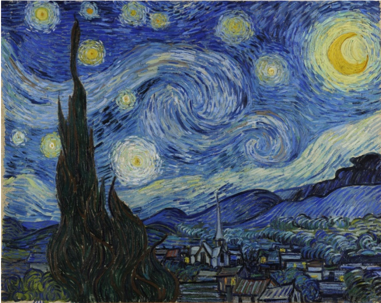
Lámina nº 3. La noche estrellada (1889), de Vincent van Gogh, Museo de Arte Moderno de Nueva York.