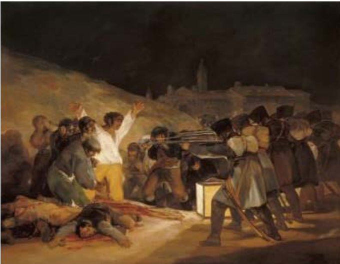
Lámina nº 1. Los fusilamientos (1814), de Francisco de Goya, Museo del Prado, Madrid.