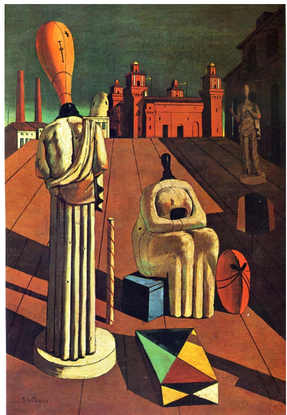
Lámina nº 4. Las musas inquietantes (1916), de Giorgio de Chirico, Colección particular.