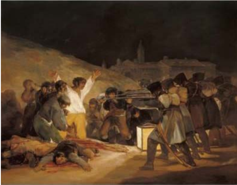
Lámina nº3. Los Fusilamientos (1814), de Francisco de Goya, Museo del Prado, Madrid.