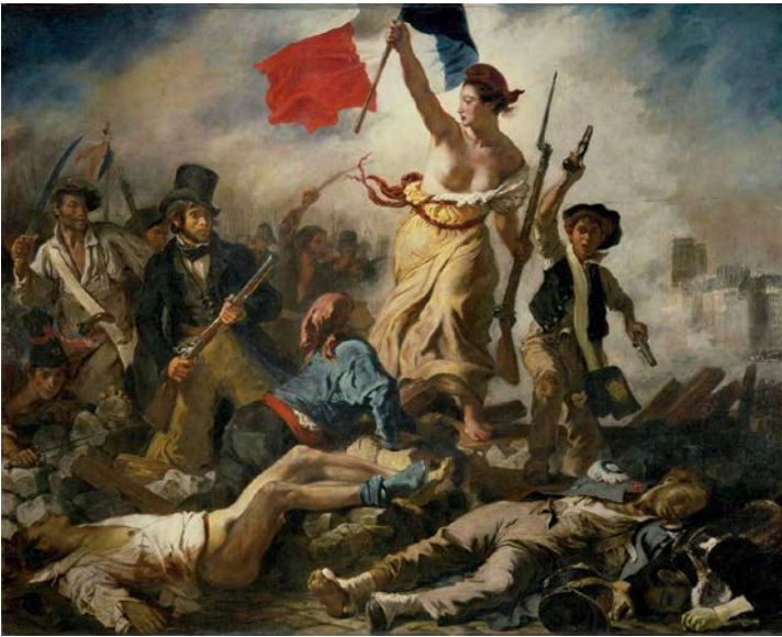
Lámina nº1. La Libertad guiando al pueblo (1830), de Eugène Delacroix, Museo del Louvre, París.