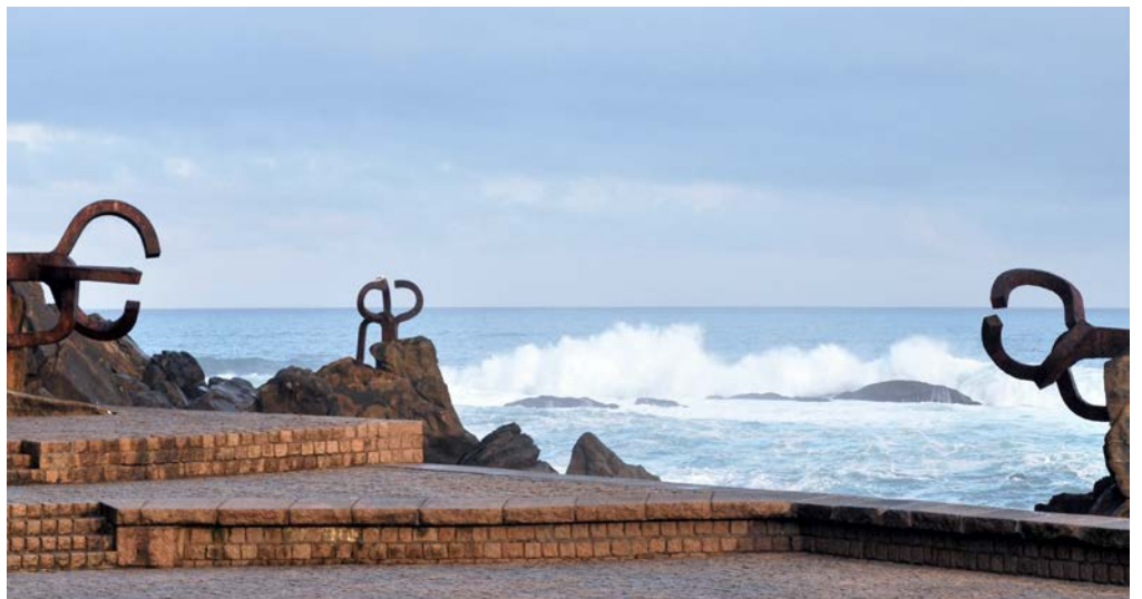
Lámina nº4. El Peine del Viento XV (1976), de Eduardo Chillida, San Sebastián.