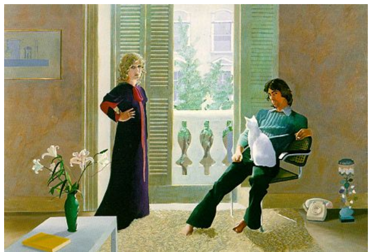
Nº4. Mr and Mrs Clark and Percy (1970-1971), de David Hockney, Tate Gallery, Londres.