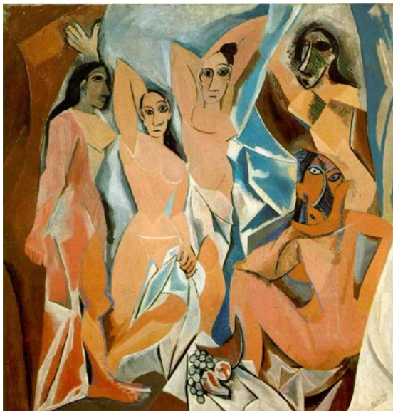
Lámina nº1. Las señoritas de Avignon (1907), de Pablo Picasso, Museo de Arte Moderno de Nueva York.