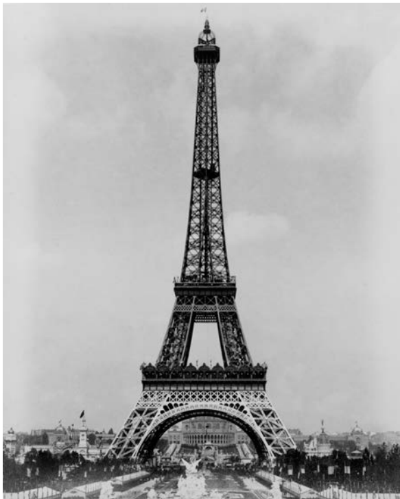
Nº 1. Tour Eiffel (1887-1889), Gustave Eiffel (París).