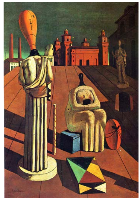
Lámina nº 2. Las musas inquietantes (1916), de Giorgio de Chirico, Colección particular.