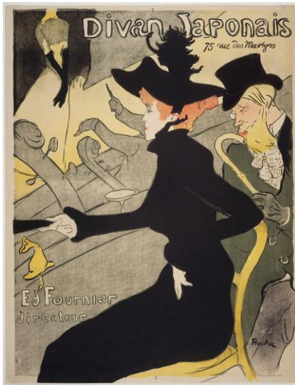
Lámina nº 2. Divan Japonais (c. 1892-1893), Henri de Toulouse-Lautrec.