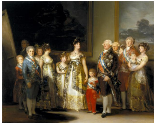
Lámina nº 1. La familia de Carlos IV (1801), Francisco de Goya, Museo del Prado, Madrid.