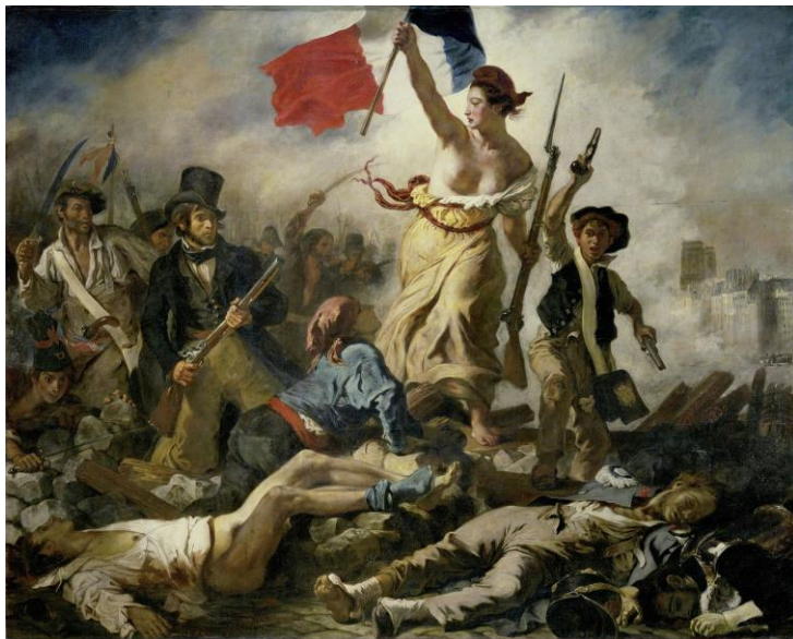
Lámina nº 3. La Libertad guiando al pueblo (1830), de Eugène Delacroix, Museo del Louvre, París.