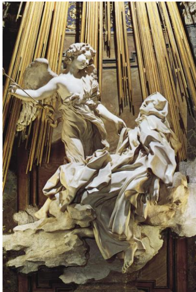
Lámina nº 2. El éxtasis de Santa Teresa (1647-1651), Gian Lorenzo Bernini, Santa María de la Victoria, Roma.