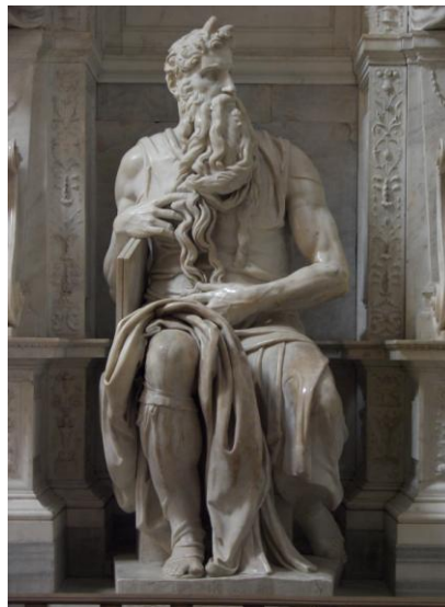
Lámina nº 3. Moisés (1509), Miguel Ángel Buonarroti, San Pietro in Vincoli, Roma.