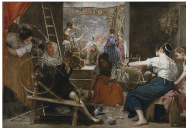
Lámina nº 4. Las hilanderas (c. 1657), Diego Velázquez, Museo del Prado, Madrid.