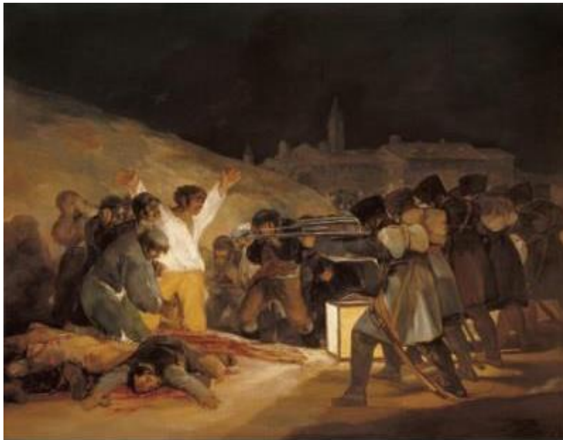
Nº2. Los Fusilamientos (1814), de Francisco de Goya, Museo del Prado, Madrid.