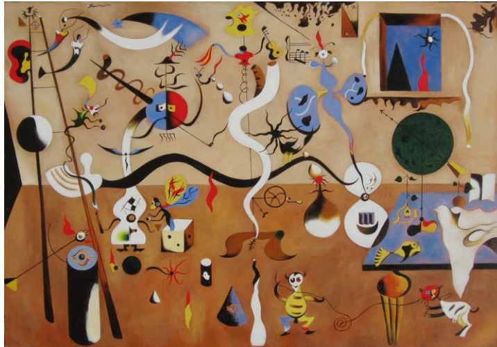
Nº 3. El Carnaval de Arlequín (1924-1925), de Joan Miró, Albright-Knox Art Gallery en Buffalo (EE.UU).