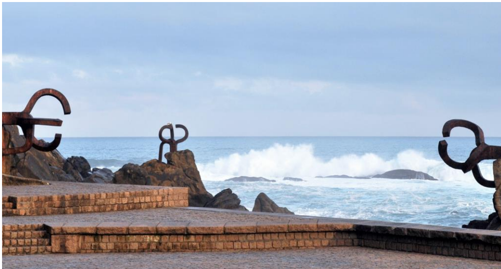
Nº3. El Peine del Viento XV (1976), de Eduardo Chillida, San Sebastián.