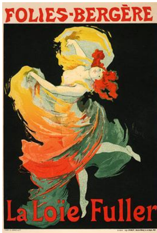
Nº 1. Folies-Bergère: La Loie Fuller (1893), de Jules Chéret.