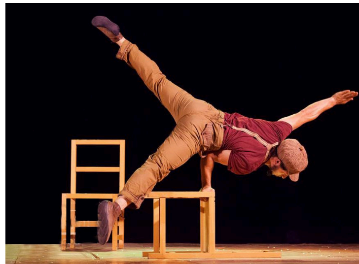
Modelo Opción a)