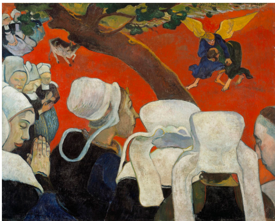
Lámina 2: Van Gogh, Visión después del sermón (1888) Galería Nacional de Edimburgo.