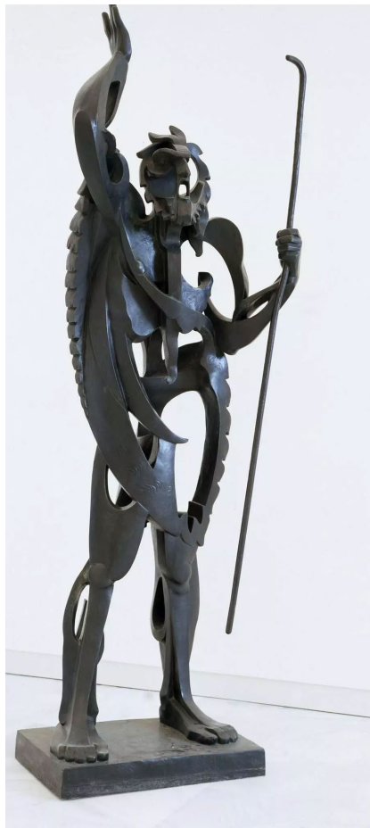
Lámina 2: El profeta (1933), Pablo Gargallo, Museo Gargallo. Zaragoza