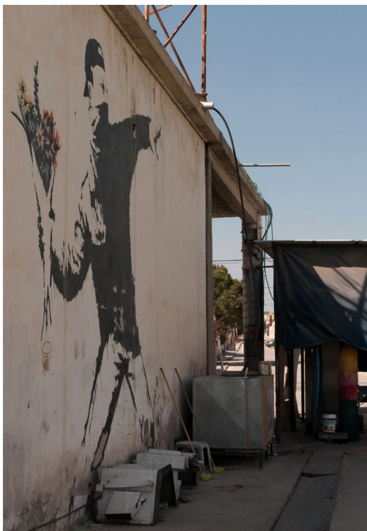
Lámina 4: Banksy, El lanzador de flores (2003) en Beit Sahour, Palestina.