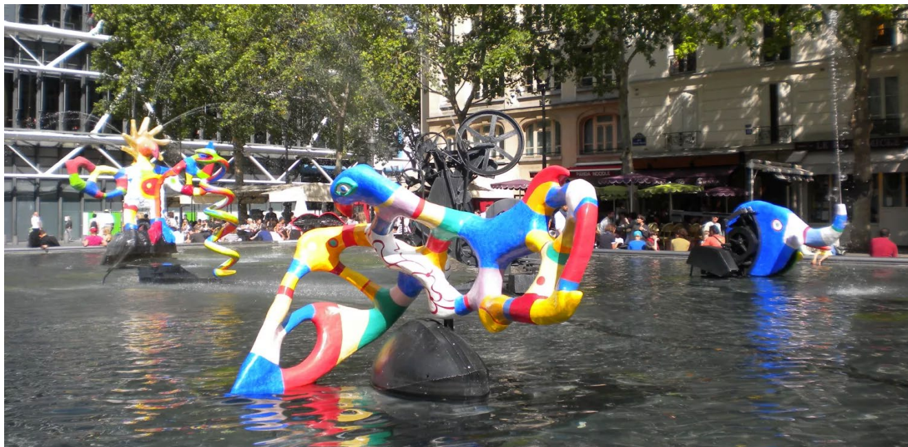
Lámina 3: Jean Tinguely y Niki de Saint Phalle, Fontaine Stravinsky (1983), Plaza Stravinski, París.

5. Elija entre una de estas dos láminas y realice su comentario: (2 puntos)