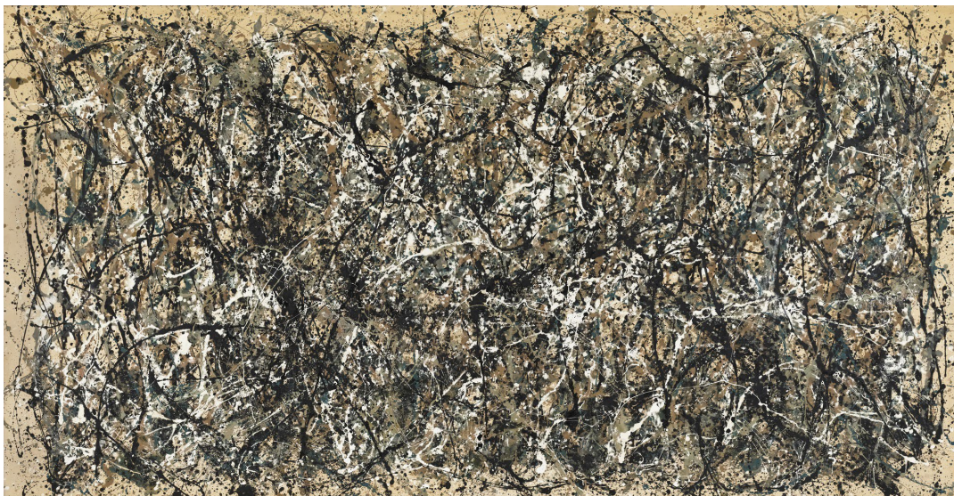
Lámina 2: Pollock, One: number 31 (1950), MoMA de Nueva York.