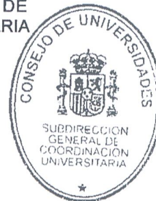
Manuel Gallego Ramos

EL SUBDIRECTOR GENERAL DE COORDINACIÓN UNIVERSITARIA